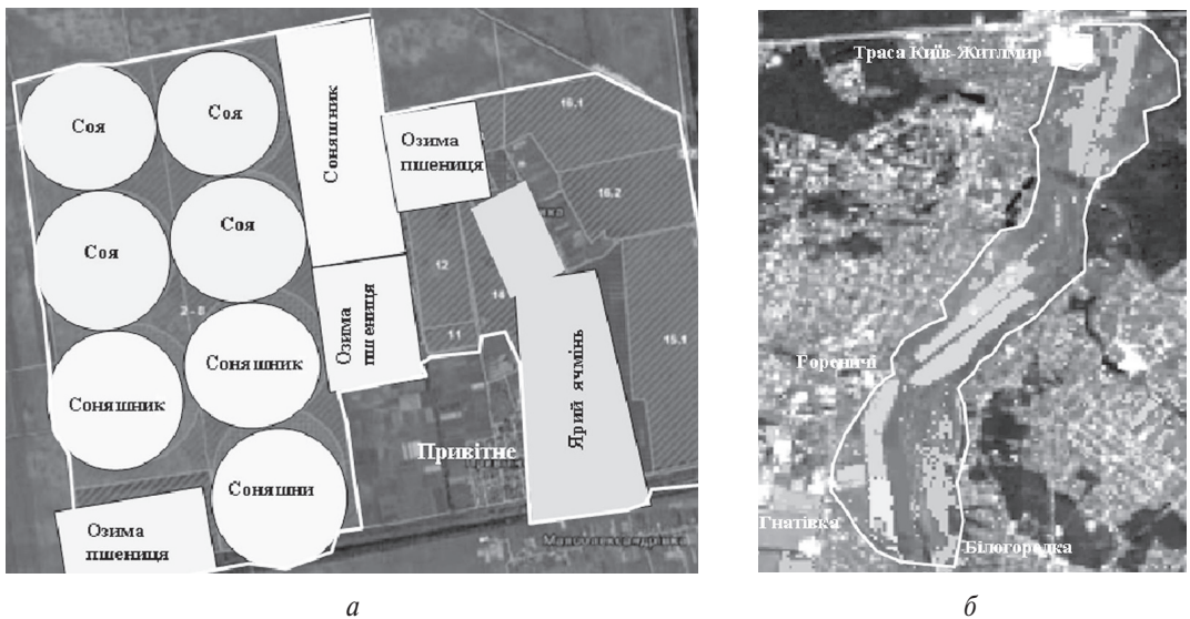
Рис. 1. Території досліджень: а — зрошені землі ДП «ДГ Брилівське», б — ділянка у межах Ірпінської ОЗС

Оскільки даних наземних спостережень виявилось недостатньо, було вирішено проаналізувати стан ґрунтів меліорованих земель (впродовж 1991–2016 рр.) за індексами вмісту оксиду заліза (ІО) та глини (СМ) [9]. За цими двома показниками оці-