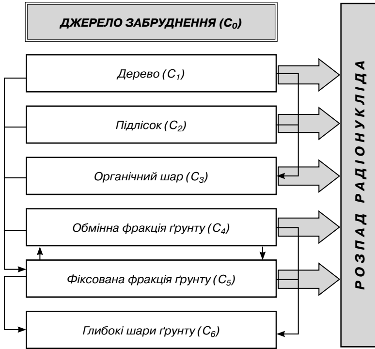
Рис. 1. Графічна формалізація компартментної моделі лісової екосистеми

Модель представлено системою диференційних рівнянь першого порядку з початковими умовами та обмеженнями на параметри (1):