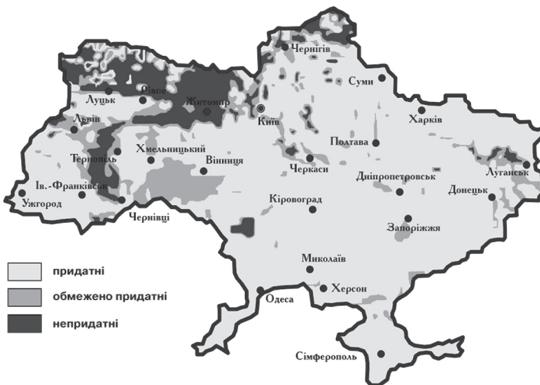
Рис. 1. Придатність ґрунтів України для мінімізації обробітку під пшеницю озиму і ячмінь