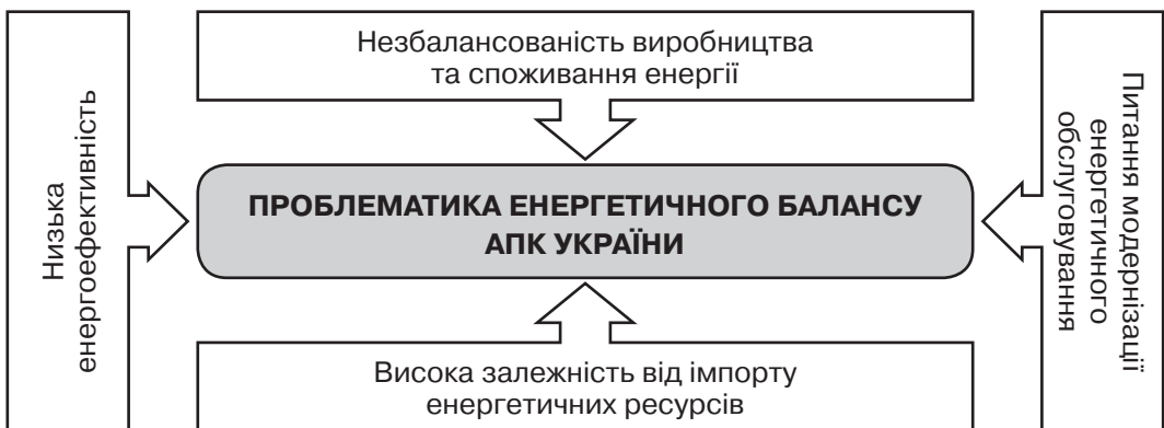
Рис. 2. Основні негативні фактори розвитку енергетичного балансу АПК

Україна має потужну сировинну базу й природні умови для розвитку і виробництва альтернативних видів палива та відновлюваної енергії. Цей потенціал України повинен стимулювати розвиток