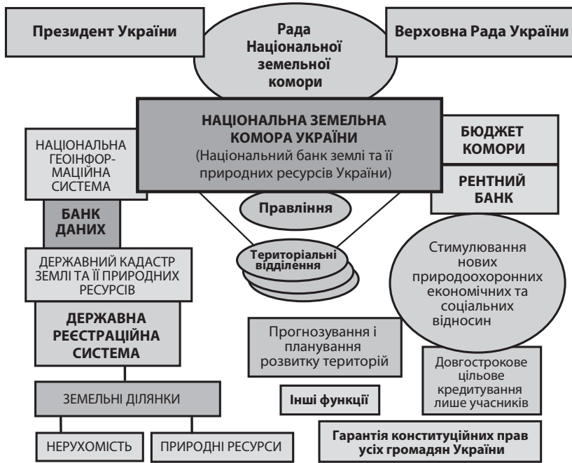
Рис. 1. Логічна схема Національної земельної установи України

Примітка: розроблено автором [газета «Урядовий кур'єр» від 8 липня 2014 р.].