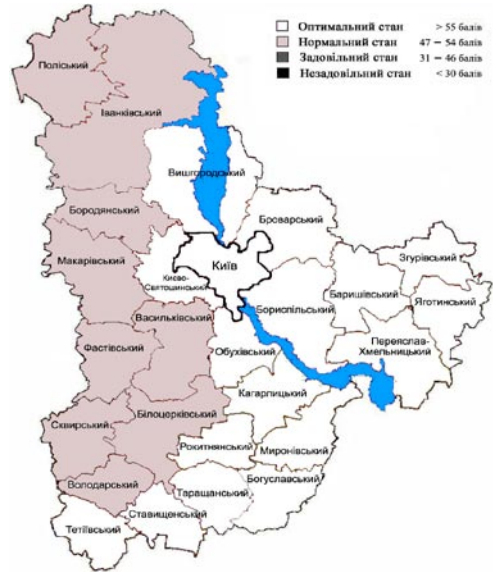
Рис. 3. Картохема придатності сільськогосподарських угідь Київської обл. для отримання зерна пшениці I класу якості за температурою повітря

Отже, проведена робота дає змогу зробити висновок, що в умовах Київської обл. зерно пшениці I класу якості без додаткових агро-технічних заходів можна отримати у лісостеповій зоні за сприятливих умов зволоження. Найпридатнішими виявилися Переяслав-Хмельницький і Яготинський райони.