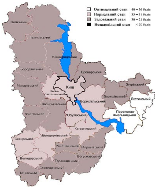
Рис. 2. Картошкама придатності сільськогосподарських угідь Київської обл. для отримання зерна пшениці I класу якості за кількістю опадів