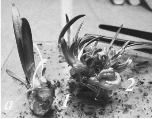
Рис. 3. Утворення первинних регенерантів Agapanthus umbellatus із експлантів на 90-й день культивування: 1 – регенеранти із основи суцвіття; 2 – регенеранти із квітки; а – утворення дочірніх рослин

на ефективність регенерації із них рослин-регенерантів (рис. 4, табл. 4). Використання донорів експлантів віком 30 і 45 днів зумовлювало низьку приживлюваність (27–58%). За висотою пагона регенеранти цих варіантів істотно відрізнялися від рослин, ізолюваних із 90-денних донорів. Так, висота регенерантів сорту Шарлотта із донорів віком 90 днів становила 82 мм при 16 і 18 мм у регенерантів із донорів віком 30 і 45 днів відповідно. Отже, для клонального мікророзмноження агапантусу сортів Шарлотта, Чорна магія доцільним є використання рослин-донорів експлантів віком 90 днів.