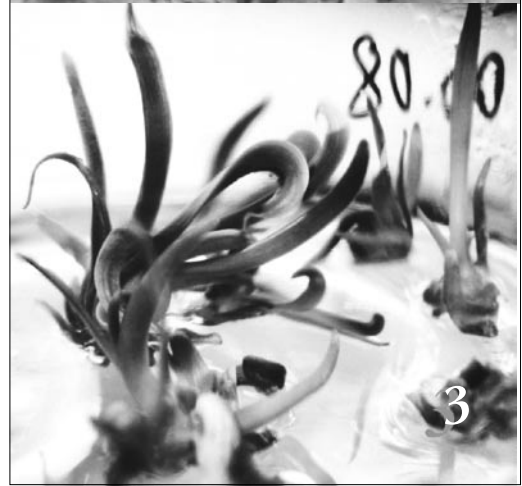
Рис. 4. Вплив віку вихідних рослин на приживання ізолюваних мікропагонів через: 1 – 30 днів; 2 – 45 днів; 3 – 90 днів