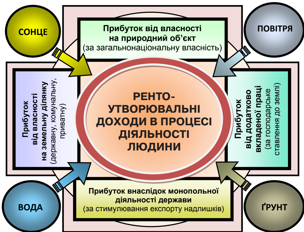
Рис. 2. Логічна схема поділу рентоутворювальних інтересів у прибутках

При цьому має функціонувати взаємозалежна формула як складова економіко-правового алгоритму, за якою величина (розмір) цінності й вартості конкретної земельної ділянки (межі) як об'єкта цивільних прав, що належить (внаслідок набуття і реалізації – ч. 2 ст. 14 КУ) певному суб'єкту (громадянину, юридичній особі чи державі) права власності і господарювання (ч. 4 ст. 13 КУ), яке (господарювання) від-