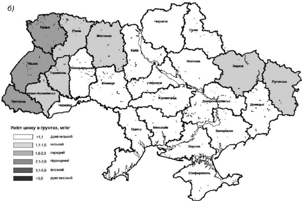
Рис. 2. Уміст рухомих форм у ґрунтах земель сільськогосподарського призначення: а — кобальту, б — цинку