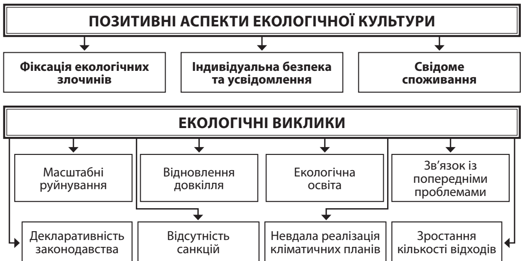
Рис. 3. Основні складові екологічної культури під час війни

Екологічна свідомість — це знання про взаємозв'язки людини і середовища, усвідомлення їх значущості з метою збереження стійкості балансу між ними; екологічна