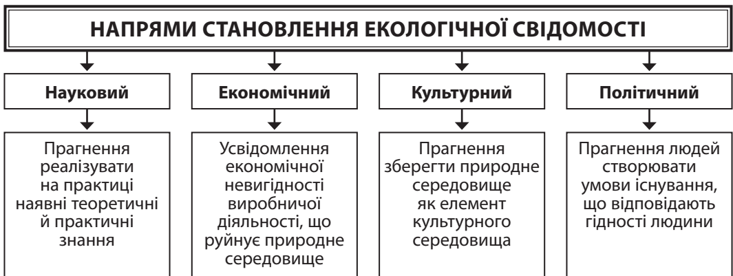
Рис. 4. Шляхи становлення екологічної свідомості громадян

Провідне місце сьогодні посідає екологічна сфера, особливо в розрізі екологічної безпеки держави, яка, своєю чергою, є складовою національної безпеки. Згідно зі Стратегією національної безпеки України до ключових пріоритетів держави нале-